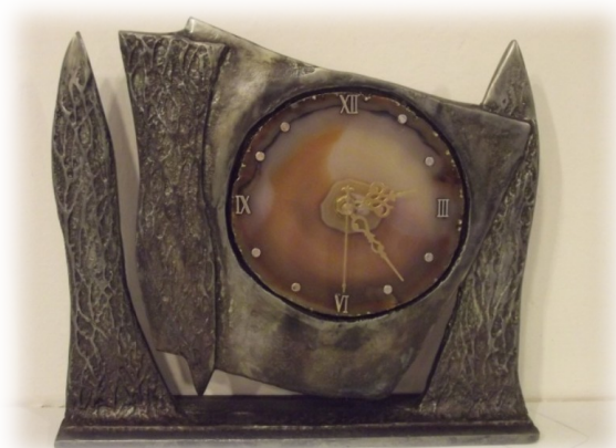
Hodiny, slitina, achát;