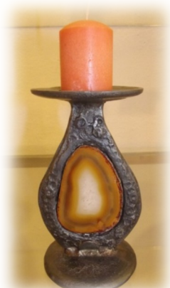
Svícen, slitina, achát;