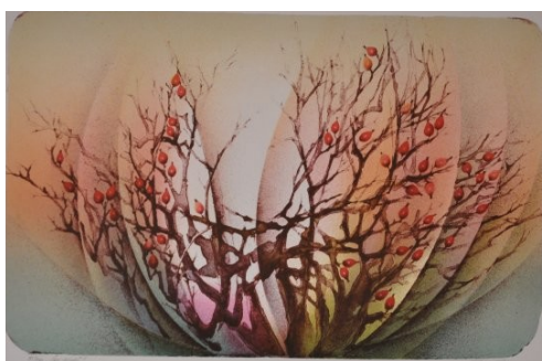
Čas plodů; litografie;

Čas od času, zejména v posledních letech po smrti mého muže, sahám i po oleji a pokouším se malovat, protože jsem naplněna pocity, které se mi ne vždy podaří v grafice zachytit a vyjádřit. Je v nich světlo a láska, a tušení pravdy, která se ptá po smyslu našich životů, a která nosí vznešené jméno – moudrost. Stále se snažím dát jí do svých obrazů, stále zkouším dát jí podobu. Čím jsem starší, tím víc ji hledám. Cítím silnou vnitřní potřebu, která zraje jako víno.“