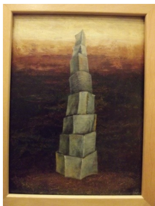
Rozhledna, olej, sol., 26,5x20,5cm;

Na obrazech Olgy Vyleťalové se setkáváme s nekonečnými krajinami, v nichž se zjevují pyramidy, věže, jakoby z nebe spadlé geometrické tvary nebo krácející postavy. Tu a tam se objevují i abstraktní kompozice. Věvodí jim především bohaté barevné tóny, které opět navozují tajemnou atmosféru.