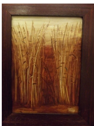
Rákosí, olej, sololit, 25x20;